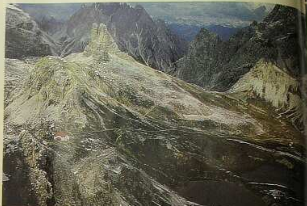
Pohled z výstupu na vrchol, vlevo sedlo Tablinger Riedel s chatou Drei Zinnen Hütte, vč. Tablinger Knoten a vpravo jezírka Bödensee.