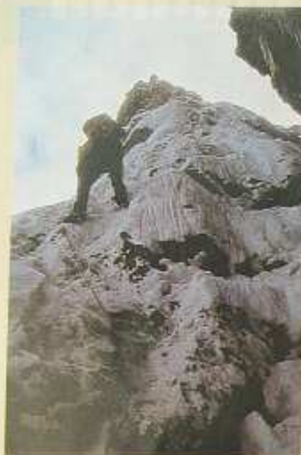
Zajištěné místo z těžé cesty: